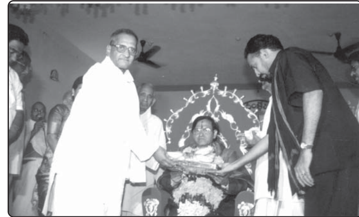
23-11-2003 తేదీ పాలకొల్లు క్షత్రియ సంక్షేమ పరిషత్ ఆధ్వర్యంలో కార్తీక సమారాధన సందర్భముగా