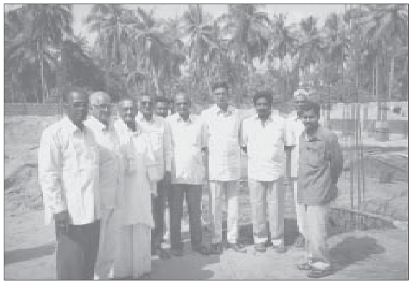
అమలాపురం క్షత్రియ కళ్యాణ మండపం కమిటీ సభ్యులతో సద్గురు శ్రీ నాన్నగారు

19-02-2003 బుధవారం గణపవరం సాయిబాబా మందిరం