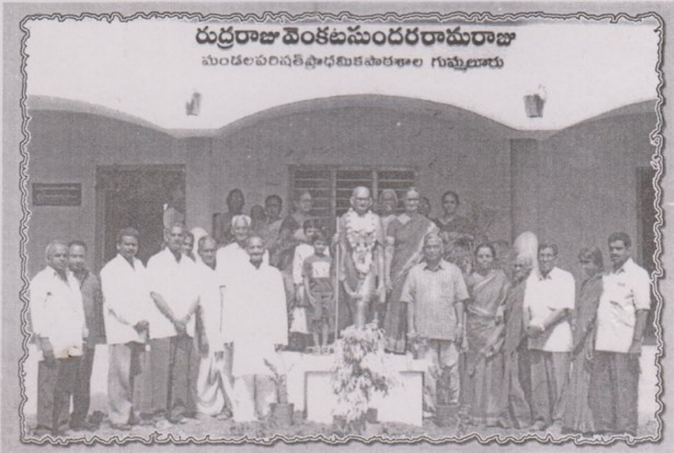
రుద్రరాజు వెంకటసుందరరామరాజు పుండలపరిషత్ ప్రాథమిక పాఠశాల గుమ్మలూరు