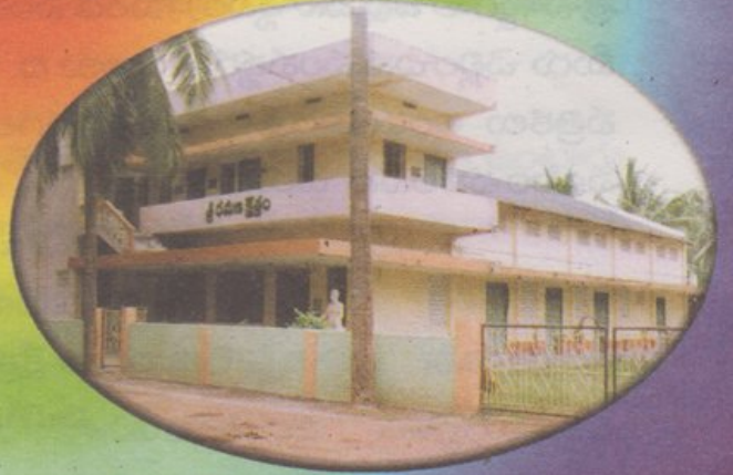
శ్రీ రమణ క్షేత్రం, జిన్నూరు