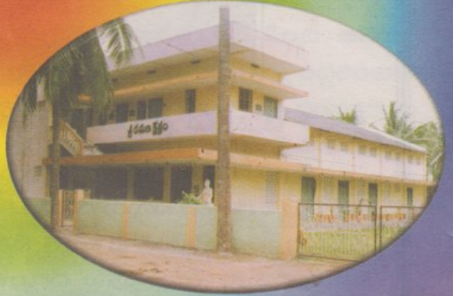
శ్రీ రమణ క్షేత్రం, జిన్నూరు