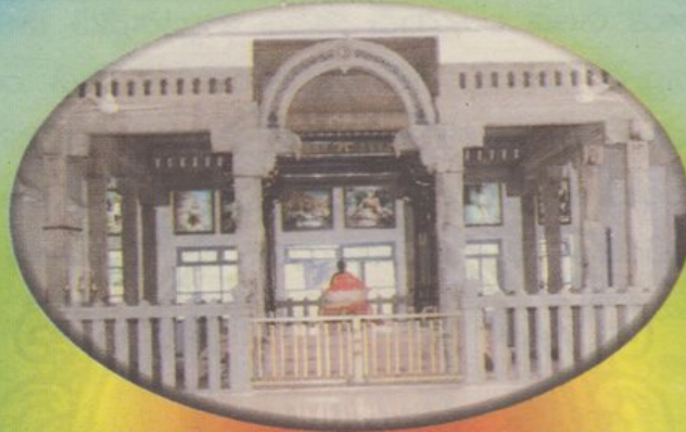
శ్రీ రమణాశ్రమం, తిరువన్నామలై