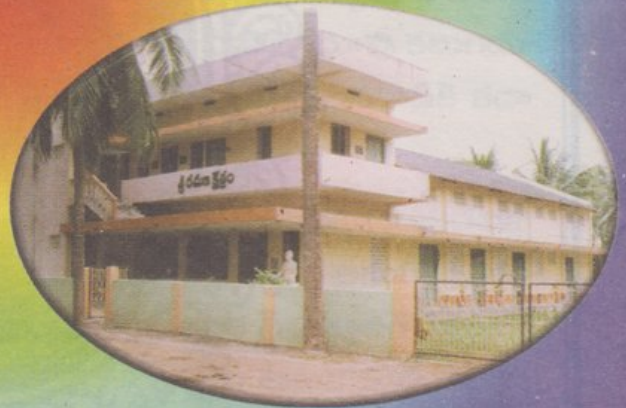
శ్రీ రమణ క్షేత్రం, జిన్నూరు