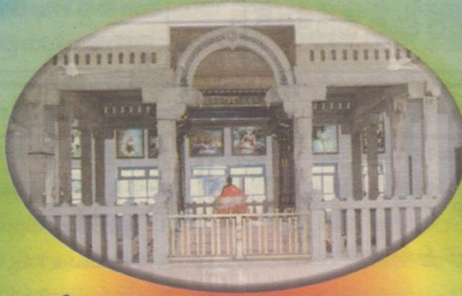
శ్రీ రమణాశ్రమం, తిరువన్నామలై