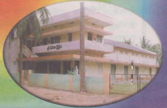
శ్రీ రమణ క్షేత్రం, జిన్నూరు