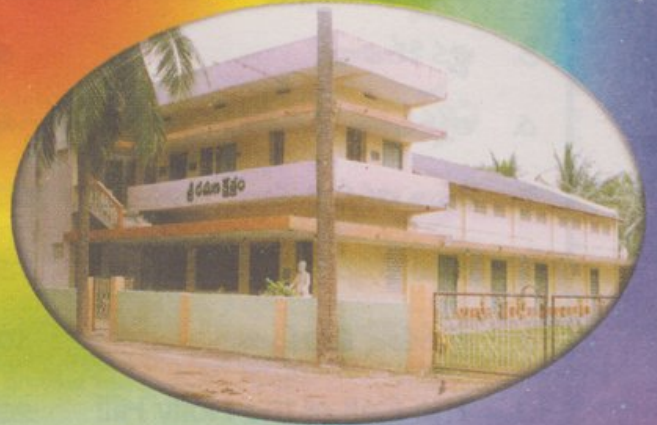
శ్రీ రమణ క్షేత్రం, జిన్నూరు