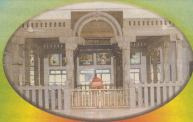
శ్రీ రమణాశ్రమం, తిరువన్నామలై