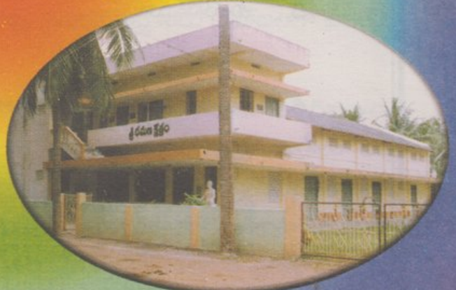
శ్రీ రమణ క్షేత్రం, జిన్నూరు