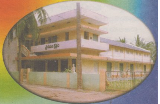
శ్రీ రమణ క్షేత్రం, జిన్నూరు