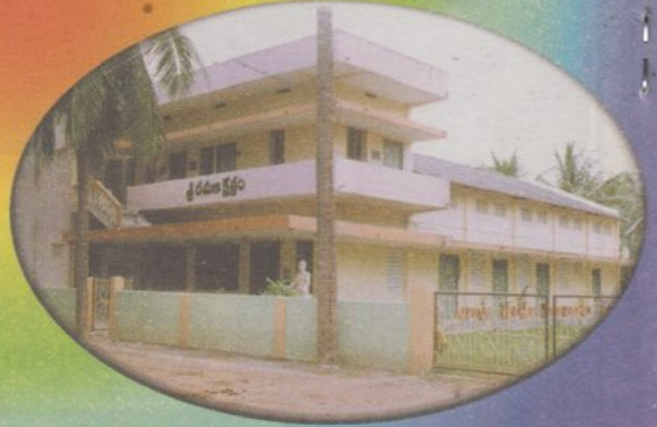
శ్రీ రమణ క్షేత్రం, జిన్నూరు