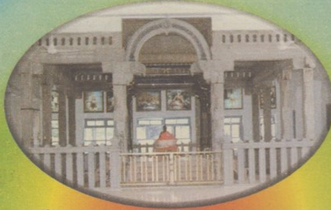
శ్రీ రమణాశ్రమం, తిరువన్నామలై