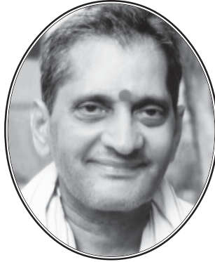
ఓం శ్రీనాన్న పరమాత్మనే నమః