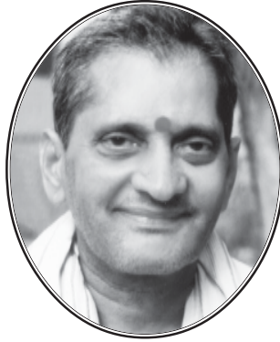
ఓం శ్రీనాన్న పరమాత్మనే నమః