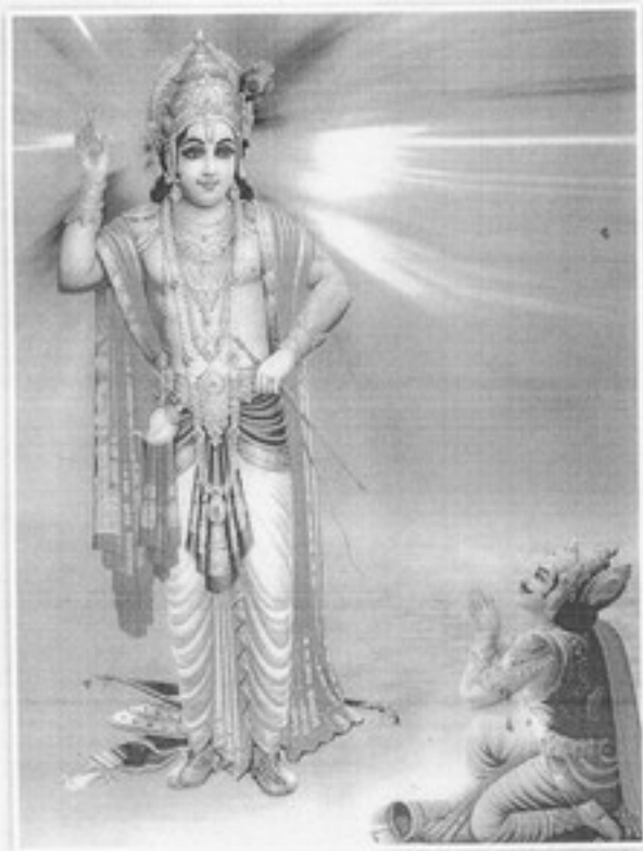
శ్రీనివాస విగ్రహం ఆరాధన