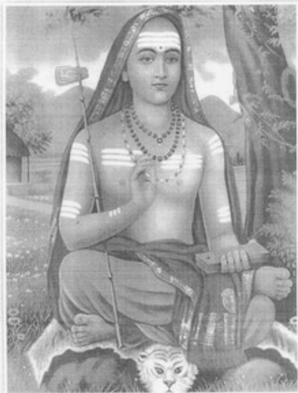
ಬೆಂಗಳೂರು ಓ ಅರಿವಿನವರಾದವರು