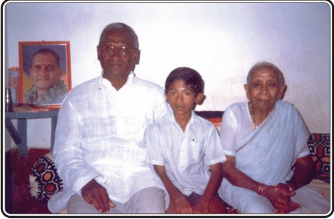
మా తల్లి సాగిరాజు చిట్టెమ్మ గారు మరియు నా మనుమడు ఆంజనేయరాజుతో నేను