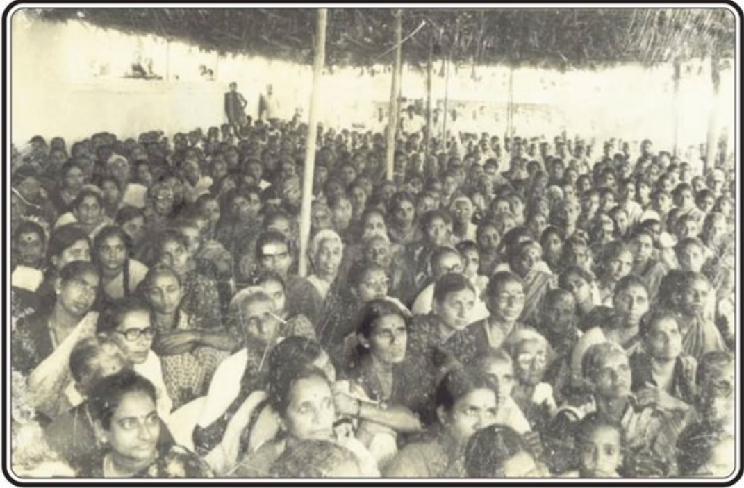
మా ఇంటి వద్ద తొలి మీటింగులో భక్తులు