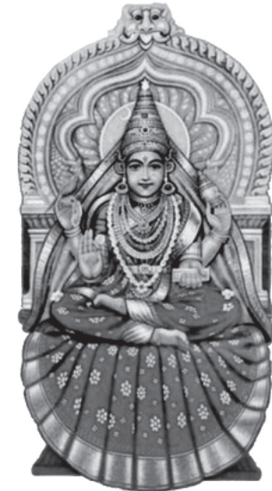
శృంగేరి శారదా మాత